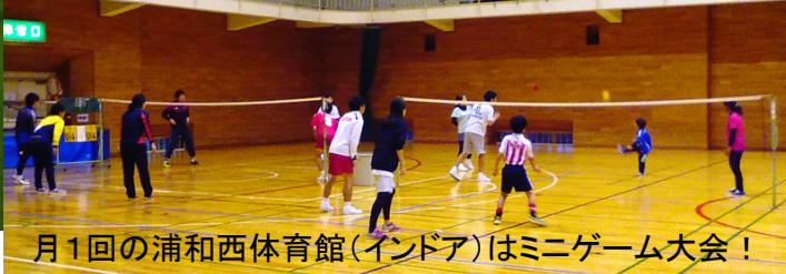
月1回の浦和西体育館(インドア)はミニゲーム大会！